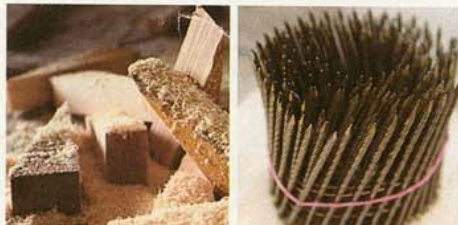
À GAUCHE, CALES EN BOIS SERVANT AU PRÉ-ASSEMBLAGE DE LA FERME. À DROITE, BOUQUET DE CLOUS.

plus économique et tout aussi performant s'il est correctement traité. Les matériaux de couverture (tuiles, ardoise...) se sont eux aussi considérablement allégés. Les grosses sections de bois (30x30 cm ou 35x35 cm) ne sont plus indispensables, d'autant qu'elles ont tendance à se gauchir davantage que deux sections accolées. « Personnellement, je n'utilise des grosses poutres que pour des raisons esthétiques, sur demande du client, ou s'il s'agit d'une restauration... »