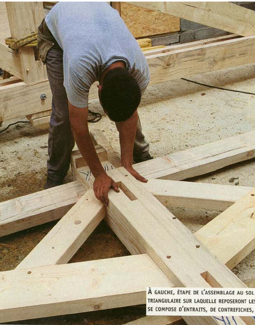
À GAUCHE, ÉTAPE DE L'ASSEMBLAGE AU SOL DE LA FERME, CETTE PIÈCE DE BOIS TRIANGULAIRE SUR LAQUELLE REPOSERONT LES PIÈCES DE LA CHARPENTE. ELLE SE COMPOSE D'ENTRAITS, DE CONTREFICHES, D'ARBALÉTRIERS ET D'UN POINÇON.